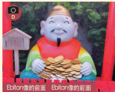
Ebitan像的前面 Ebitan像的前面

■推荐集合地点和休息场所! 我们全力于打造成为大阪的新地标, 同时成为一处崭新的观光胜地。 ■推荐的集合地点或是休息站! 为最新观光景点将是大阪不久将来的象征空间。