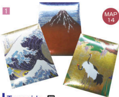
1 Tansendo 銀

列为日本三名城之一的大阪城天守阁是以天下统一作为目标的丰臣秀吉1583年开始修筑的。此后，天守阁被2次烧毁了，但是1931年通过市民们的捐献被再次建造了。天守阁是高55m，5层8楼，屋顶的兽头瓦，栏杆下的伏虎等，各个/箇地方都被用黄金来装饰的灿烂闪耀。从8楼的展望台能眺望大阪的全貌。