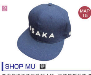
2 SHOP MU 銀

美好的回忆和好伙伴的照片可以放在这里装饰。 美好的回忆和好夥伴的照片可以放在這裡裝飾。