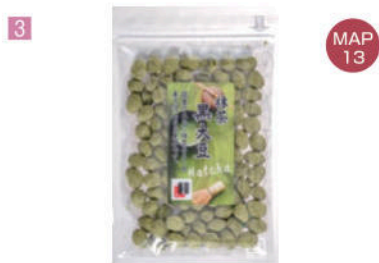
3 Oguraya 銀

日本制造的质量是放心的。方便佩戴的热门样式绅士爵士帽。 日本製造的質量是放心的。方便配戴的熱門樣式紳士爵士帽。