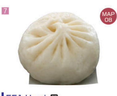
7 551 Horai 銀

行李箱，拉杆箱常有200多个。PORTER, THE NORTH FACE, anello等名牌产品应有尽有。 手提旅行箱，大型行李箱，200件以上必備款型，種類豐富，有PORTER, THE NORTH FACE, anello等，著名品牌任您選購。