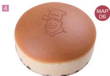
4 Rikuro Ojisan's Shop

是抹茶牛奶味黑豆。使用国产黑豆制成。 使用在地國產黑大豆製作，牛奶抹茶口味的黑大豆。