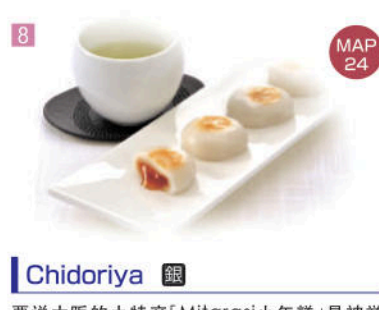
9 Chidoriya 銀

洋菓子的广田(公司)创立于1924年在大阪。一盒有4个奶油泡芙是广田的招牌商品。使用新鲜的鸡蛋和牛奶制作的卡士达奶油，口感浓郁让人回味无穷。 HIROTA洋菓子的招牌商品，每一個盒裡裝入四個奶油泡芙。使用新鮮雞蛋和香醇牛奶製作，濃郁的卡士達奶油豐富道地的味道。