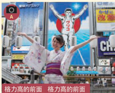
格力高的前面 格力高的前面

■大阪有名的格力高的招牌做一样的姿势来拍照 ■大阪有名的格力高的招牌做一样的姿势来拍照