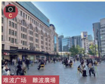
难波广场 難波廣場

■推荐集合地点和休息场所! 我们全力于打造成为大阪的新地标, 同时成为一处崭新的观光胜地。 ■推荐的集合地点或是休息站! 为最新观光景点将是大阪不久将来的象征空间。