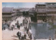
橋本開港資料館所藏

「戎橋」被架起的是從現在開始大約400年前。這個名字是由通往「生意興隆」的祈願而有名的今宮戎神社的參拜用的道路由來的。「戎橋」是在橋週邊的街道管理的橋樑。修理和整頓、清掃等工作都是街道的民眾擔任的。戎橋是與大阪南部的街道心心相連的。