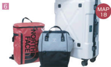
6 Jaguar Kaban 銀

用可爱的小瓶包装的金平糖是仿照霓虹灯下道顿堀河的样子制作的! 放入可愛的瓶子裡的金平糖，是以映照著道頓堀川的霓虹燈光的樣子而設計的。