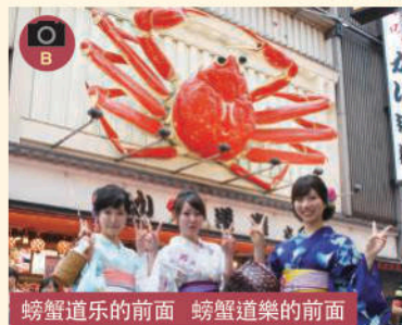
螃蟹道乐的前面 螃蟹道樂的前面

■大阪有名的格力高的招牌做一样的姿势来拍照 ■大阪有名的格力高的招牌做一样的姿势来拍照