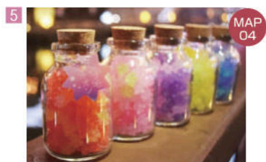
5 Ichibirian 銀

为您准备了超人气芝士蛋糕。 直接於店內設置烤爐，以隨時提供剛出爐的高人氣起司蛋糕。